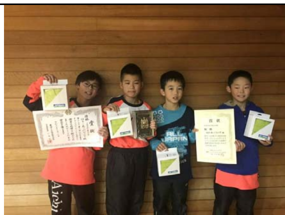
6年以下男子優勝 はりーあっぷジュニア