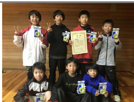
6年以下男子準優勝 西尾ジュニアA