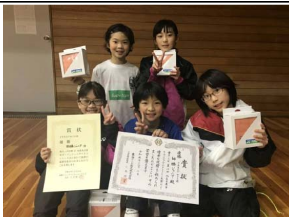
4年以下女子団体優勝 師勝ジュニア